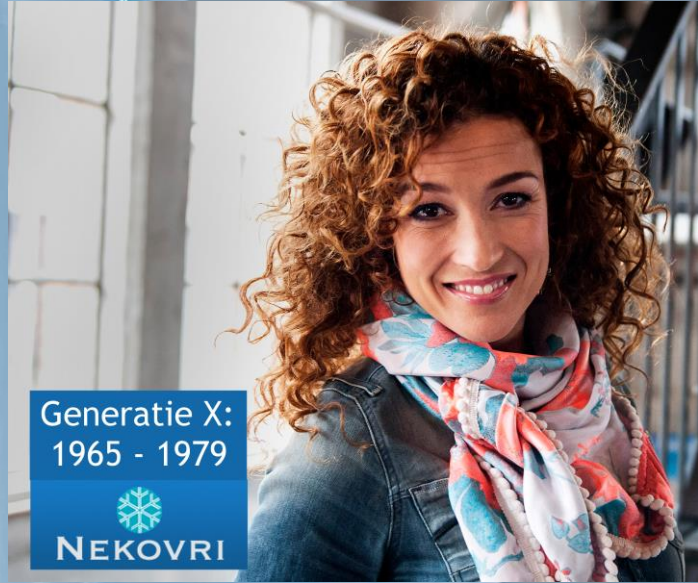
Generatie X: 1965 - 1979