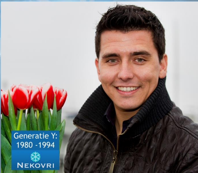
Generatie Y: 1980 - 1994