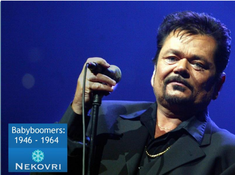
Babyboomers: 1946 - 1964