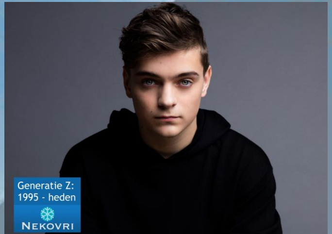
Generatie Z: 1995 - heden